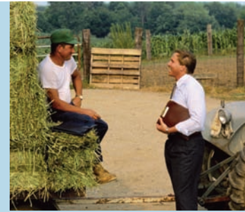
Der lokale MFI-Mitarbeiter pflegt einen intensiven Kontakt mit dem Kunden

institutionen stehen. Dadurch können wir zeitnah auf die Finanzierungsnachfrage unserer Partnerinstitutionen reagieren. Zudem hat der EFSE über einen separaten Trust Fund, die sogenannte Development Facility, die Möglichkeit, Projekte zur technischen Unterstützung mit seinen Partnerinstitutionen durchzuführen. Dabei geht es um Themen wie das Risikomanagement, die Produktentwicklung – etwa für den ländlichen Raum, Stichwort Agrofinance – oder auch das Kostenmanagement. Der EFSE cofinanziert diese Consulting- und Trainingsmaßnahmen für seine Partnerinstitutionen bisher über Mittel öffentlicher Geber bzw. regierungsnaher Organisationen. Erklärte Strategie ist, den Finanzmittelbedarf auch durch institutionelle Investoren oder Spenden zu decken. Von daher begrüßen wir das Engagement der VR LEASING sehr.