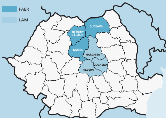
Zielmärkte der FAER und LAM

Zur fundierten Unterstützung der Mikrofinanzinstitute (MFI) gehört der Transfer spezifischer Kompetenzen, um die Betreuungsgüte vor Ort zu verbessern. Die Basis für die weitere Qualifizierung der Institute legt die VR LEASING mit dem gebündelten Know-how eines Kompetenzteams: Experten der EFSE Development Facility, die bereits über Erfahrungen in Beratungs- und Trainingsprojekten zu Finanzfragestellungen in Schwellen- und Entwicklungsländern – und insbesondere Mikrofinanzthemen – verfügen.