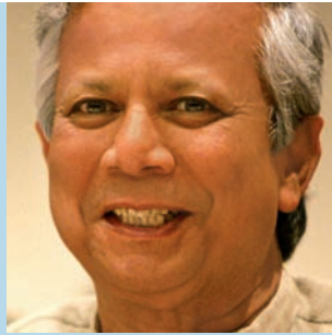
Friedensnobelpreisträger Muhammad Yunus, Grameen Bank