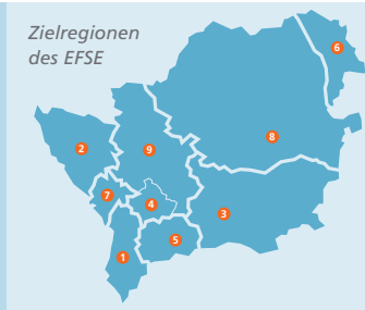
Zielregionen des EFSE 1 Albanien, 2 Bosnien und Herzegowina, 3 Bulgarien, 4 Kosovo, 5 Mazedonien, 6 Moldawien, 7 Montenegro, 8 Rumänien, 9 Serbien