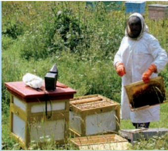
Imkerei in Rumänien